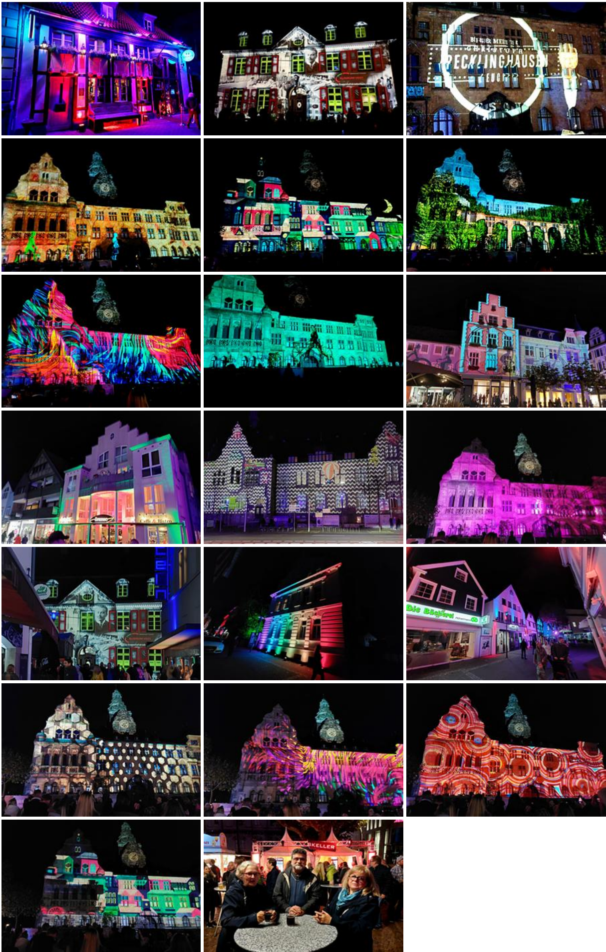
Recklinghausen leuchtete wieder